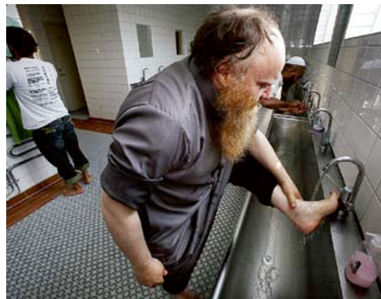
FÖRE BÖN. Bönen i islam föregås av en rituell tvagning, så kallad wudu. Den ska utföras i en viss ordning och innehålla särskilda element. Till exempel ska hela foten upp till ankeln tvättas tre gånger.